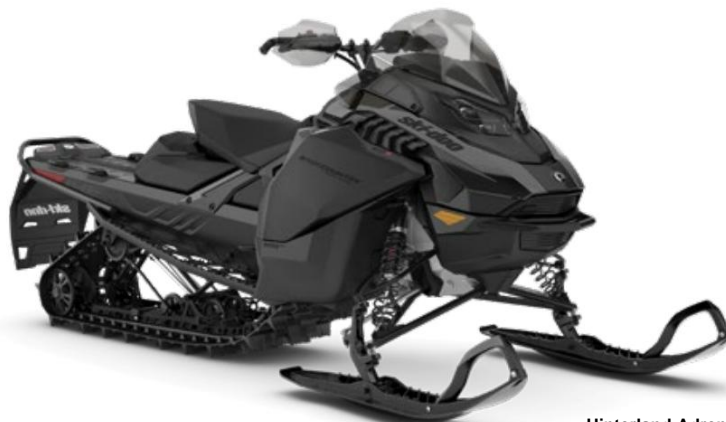
Hinterland-Adrenalin 600R E-TEC ABGEBILDET

Vollgepackt mit Crossover-spezifischen Funktionen, mit denen Sie gleichermaßen viel Zeit auf und abseits der Piste verbringen können.