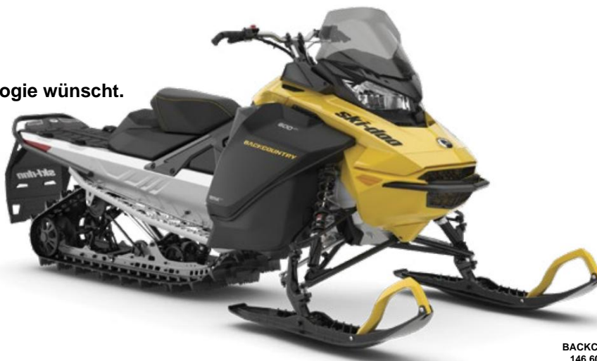
BACKCOUNTRY-SPORT 146 600 EFI ABGEBILDET

Für den wertorientierten 50-50-Fahrer, der eine fortschrittliche Plattform und moderne Motorentechnologie wünscht.