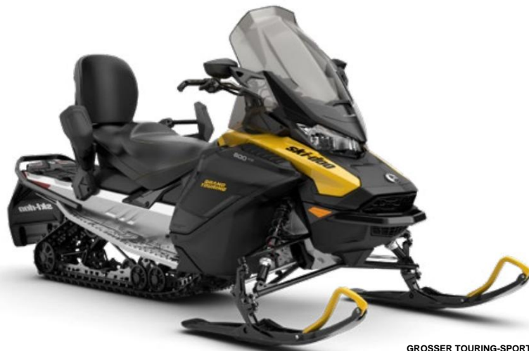
GROSSER TOURING-SPORT 600 ACE ABGEBILDET

Trail-Komfort und Zweisitzer-Funktionen mit präzisiertem Handling und cleverem Stil.