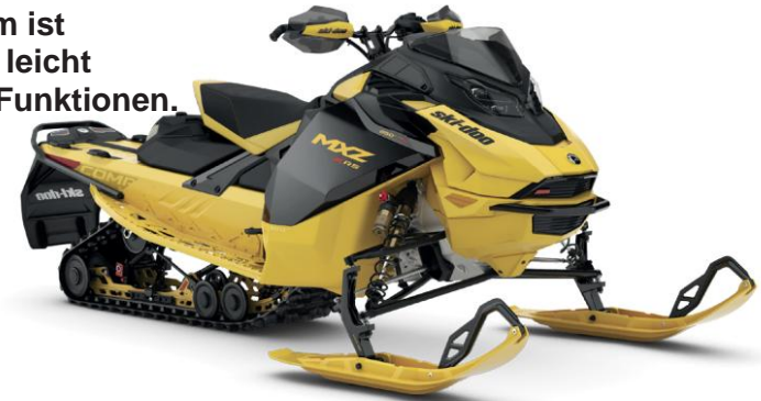
MXZ X-RS 850 E-TEC TURBO R MIT ABGEBILDETEM WETTBEWERBSPAKET