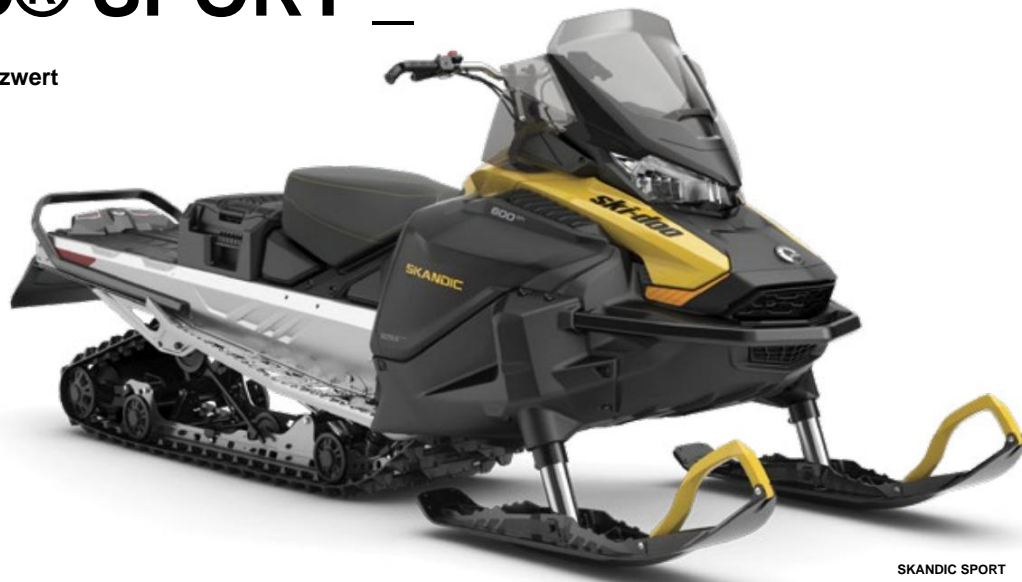
SKANDIC SPORT 600 EFI ABGEBILDET

Das beste 20-Zoll-Modell. Nutzwert beim Schneemobilfahren.